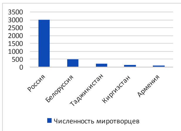
Рис. 4. Численность миротворцев государств – членов ОДКБ, направленных в Казахстан

Уже 7 января первые подразделения миротворцев прибыли в Казахстан. Российский контингент миротворческих сил ОДКБ составил большую часть направляемых в Республику сил и техники (рис. 4).