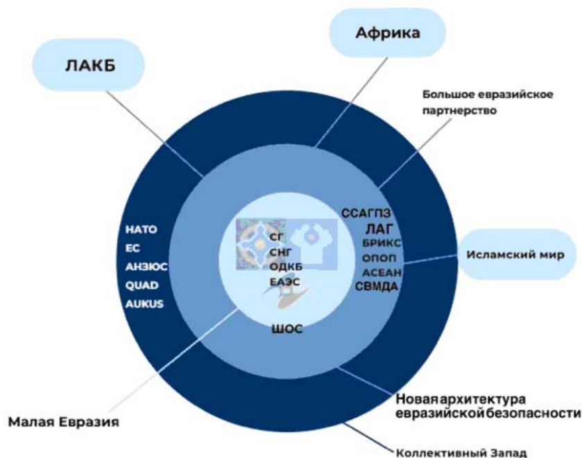
Рис. 1. Российская внешняя политика: развитие евразийской архитектуры безопасности

В начале 2000-х гг. развивалась политика революционной смены политических режимов на постсоветском пространстве. «Революция роз» в Грузии в 2003 г., «Оранжевая революция» на Украине в 2004 г. и «Тюльпановая революция» в Киргизстане в 2005 г. были объединены под общим названием «цветные революции». «Цветная революция» является формой государственного переворота с насильственной