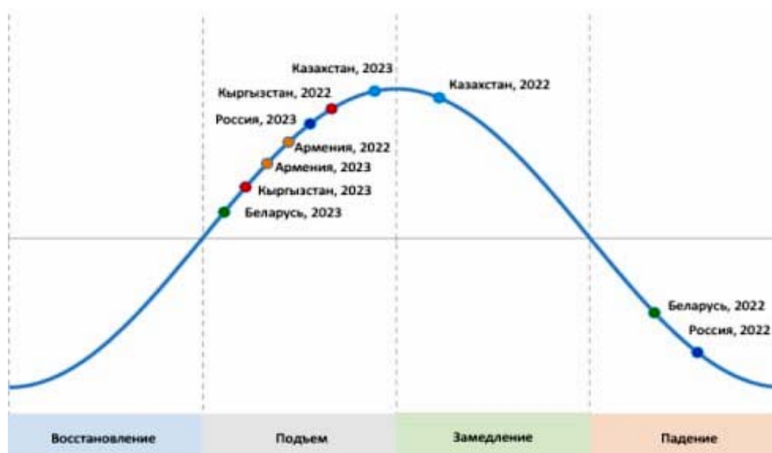
Рис. 2. Основные социально-экономические показатели стран СНГ (январь-октябрь 2022 г., % к январю-октябрю 2021 г.)