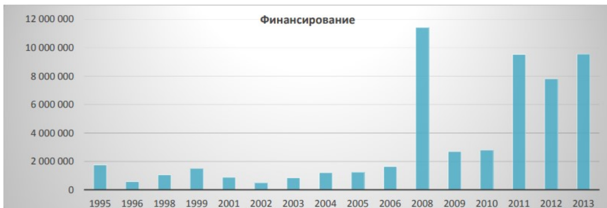
Диаграмма 1. Финансирование ЕС в Казахстан в рамках программы ТЕМПУС 1

Программа Эрасмус Мундос так же является проектом сотрудничества в сфере высшего образования, в котором предусмотрены: