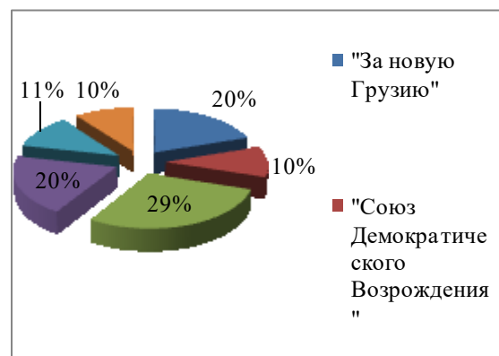
Рисунок 1.1. - Результаты выборов в Грузии 2003 г., % [Де Ваал. 2011]

Первоначальные результаты выборов показывали уверенную победу партии «За Новую Грузию», однако это вызвало многочисленные протесты среди избирателей. После пересчета голосов, победу одержала партия М.Н. Саакашвили (см. рисунок 1.1.).